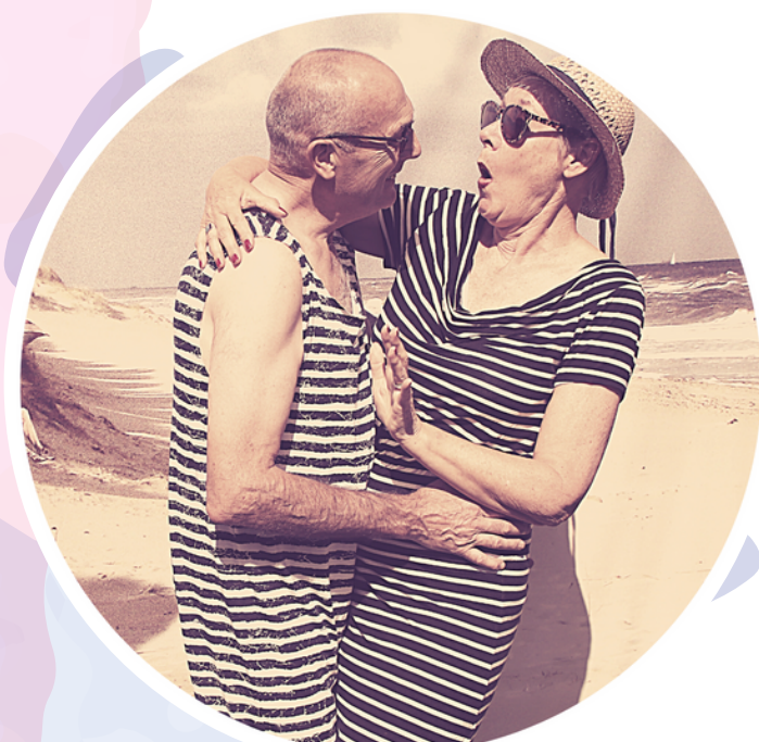
ouders van...(dreamteam) hout- en naaiwerk