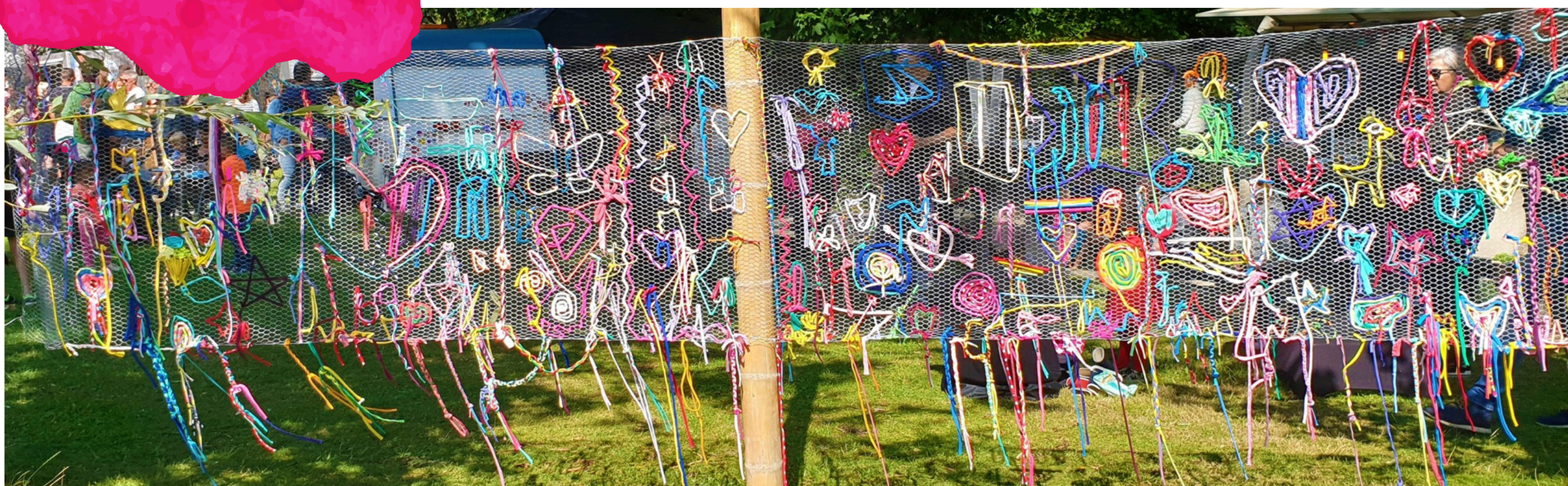
FIGURE WEAVING XL

Of het werk mag blijven hangen? Jazeker, met deze activiteit kan iedereen lekker weven en knobbelen en je hebt ook nog eens een leuk eindresultaat dat kan blijven hangen. Op grote stroken kippengaas (gespannen tussen onze nieuwe rekken, bomen of palen) en losse kippengaas figuren kunnen de deelnemers vrij weven met gekleurde touwen van gerecycled materiaal. Waar de een eindigt, kan de ander verder... Samen weven, ieder aan een kant van het kippengaas, is superleuk! Ben je ook zo benieuwd naar het eindresultaat?