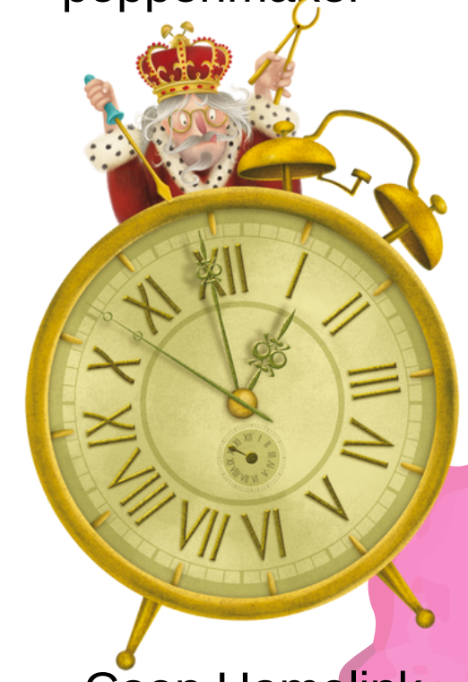
Coen Hamelink, illustraties